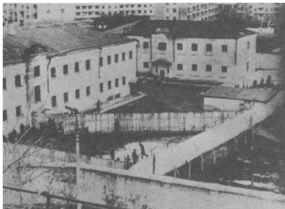
Фото 3 и 4. Орловская СПБ.