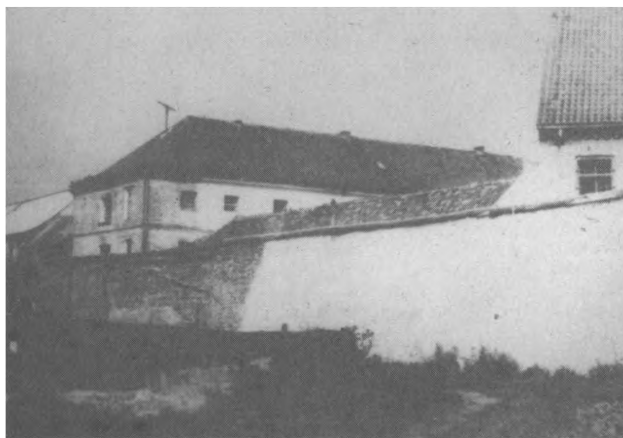
Фото 5. Черняховская СПБ.