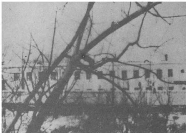
Фото 1. Казанская СПБ.

9 и 10 женские отделения Казанской СПБ переведены в Алма-Атинскую СПБ.