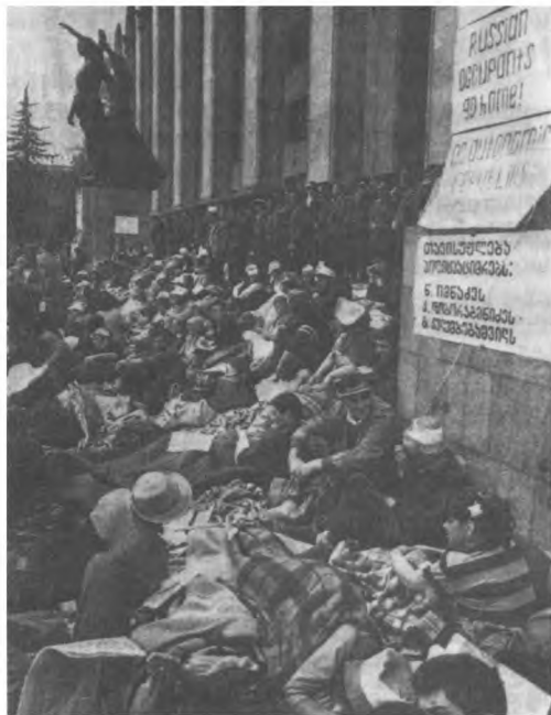
Тбилиси. У Дома правительства 7 апреля

людей объявили о начале голодовки. 4 апреля число участников голодовки достигло 150. Голодающие разместились на ступенях Дома правительства. С этого дня митинг в Тбилиси стал практически непрерывным. А со следующего дня по всей Грузии начались забастовки.