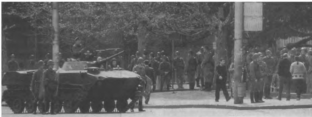
Тбилиси после кровавой ночи

демонстрации, даже если их квалифицировать как многотысячные "сборища, инспирированные кучкой экстремистов".