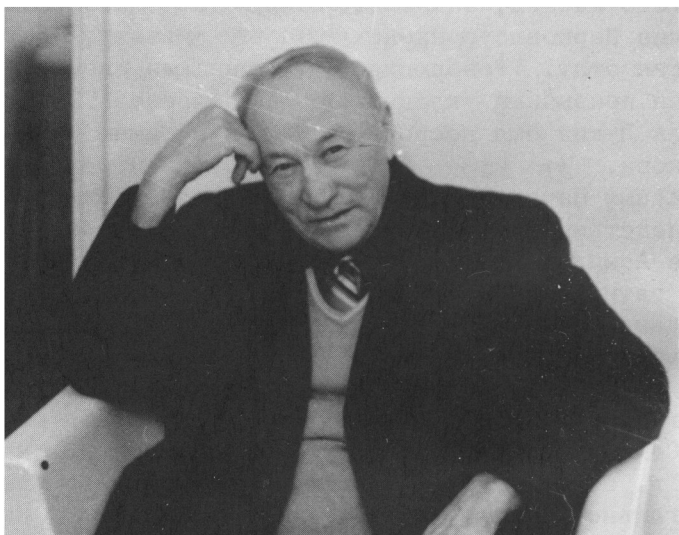
Автор Сборника Песен: Степан Лукич Софронов