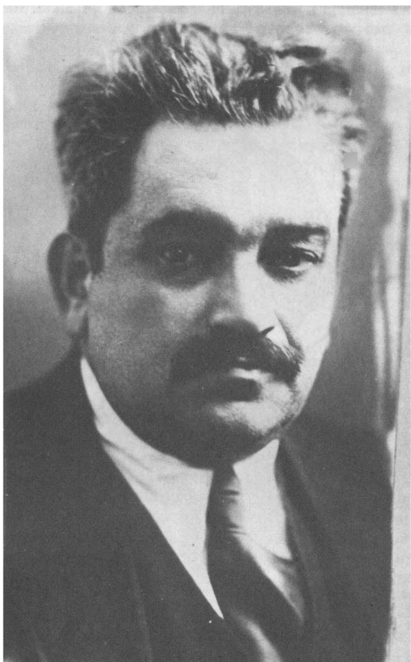
Соломон Яковлевич Лурье