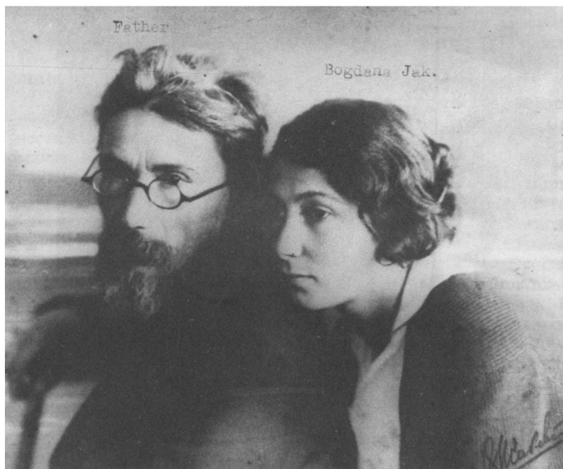
Богдана Яковлевна с отцом.