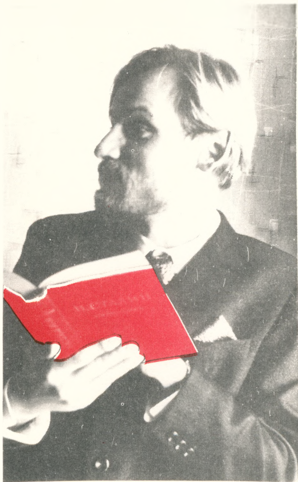
Н. БОКОВ В МОСКВЕ ЗА ИЗУЧЕНИЕМ ТРУДОВ И. СТАЛИНА